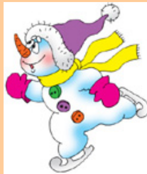
Рисунок Валентины Черняевой