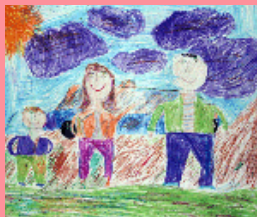
Рисунок "Хороший день": Лебедев Илья, 7 лет, г. Красноярск