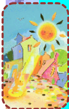
Иллюстрация: Ульяна Шалина

Тёплым, ярким пятнышком На листочке белом. Я к нему на цыпочках Подошла несмело,