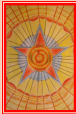
Рисунок Станислава Филимонова, 13 лет «Орден Победы»