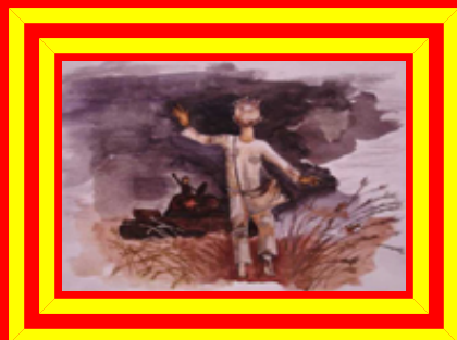
Рисунок Сергея Марценкевича 12 лет «Юный герой»