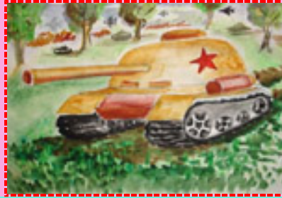
Рисунок Винокурова Дениса, 11 лет - «Путь к победе»