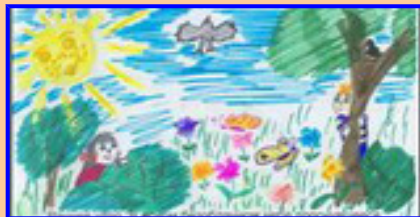
иллюстрация Веры Шаховой

Раннее утро. В ясном безоблачном небе проснувшееся солнышко потягивалось своими лучиками. Просыпались цветы в клумбах, раскрывая яркие бутоны навстречу заре. Весело щебетали птицы: «Утро наступило! Вставайте!» Бездомные собаки и кошки бегали в поисках