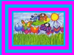
Рисунок Веры Соколовой, 9 лет «Волшебный полёт»