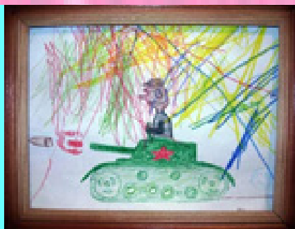
Рисунок Паши Липченко, 7 лет