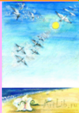
Рисунок Натальи Губановой

Поезд едет, поезд мчится. Мне на месте не сидится. Ложка прыгает в стакане. Еду, еду к другу Ване! Еду к морю, в город Сочи. Побыстрей летели б ночи! И стоянки б отменили: Что в Ростове мы забыли? Пассажиры! Торопитесь! Быстро все в вагон садитесь! Что вы, дяди, тут стоите? Лучше поезд подтолкните. Чтобы вмиг он разогнался, И, как ветер, к морю мчался!