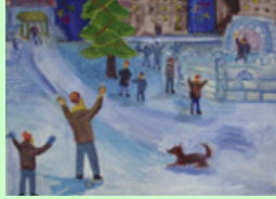
Рисунок Ильи Червина 11 лет.

Ай, какой хороший город старший брат нарисовал! Окна, флаги, море, горы! Клумба - словно карнавал! Вот вам солнце, вот вам дождик. Без улыбок - нет людей!..